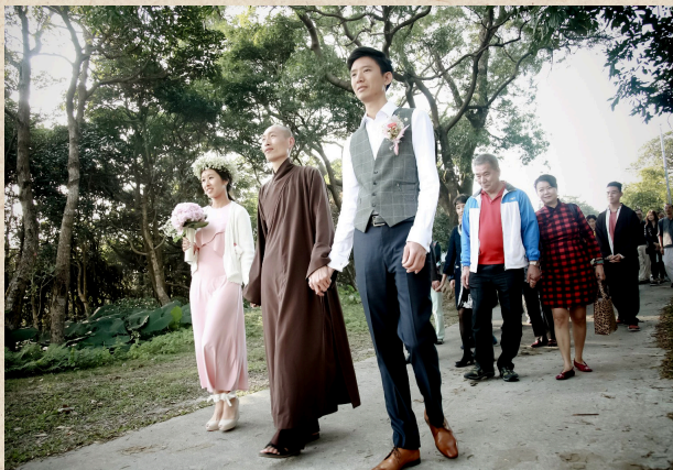
筆者兩人在梅村香港（蓮池寺）舉行佛法婚禮。

遠處傳來「叮嚀、叮嚀」的鐘聲，在一片藍天下，人們都把手上的工作放下、停下腳步，我們回到當下，感受一呼一吸，我們知道我們到家了，這是我們梅村的初體驗，之後我們一起圍着圈唱歌，看見法師的笑容和同修們的自在，和以往認識的佛教很不一樣，很好奇他們快樂的秘密是什麼。